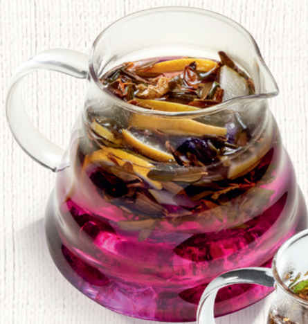
Личи – алоэ Саган дайля, сироп личи, алоэ, анчан, яблоко, лимон 500 мл | 480