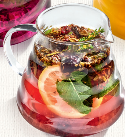
Таежный сбор с лесными ягодами шиповник, мята, розмарин, Саган Дайля, пюре из лесных ягод и травяной сбор 500 мл | 480