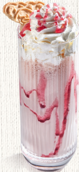
Малиновый с песочным печеньем и шоколадом 350 мл | 390