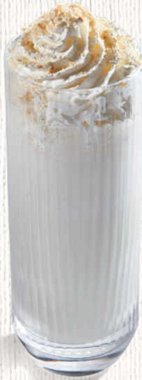
Ванильный 350 мл | 390