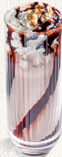
Шоколадный с арахисом 350 мл | 390