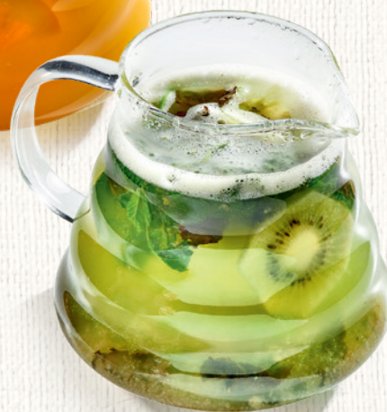
Зеленый чай с фейхоа и мятой 500 мл | 480