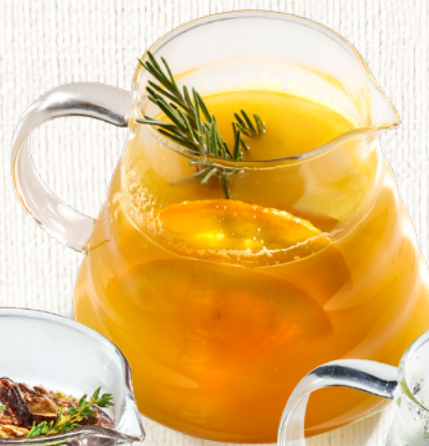
Облепиха – маракуйя Облепиха, маракуйя, розмарин, апельсин, лимон, чай жасминовый, мед 500 мл | 480