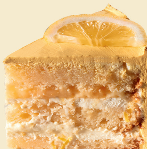
Торт лимонный | 370 ₽ |