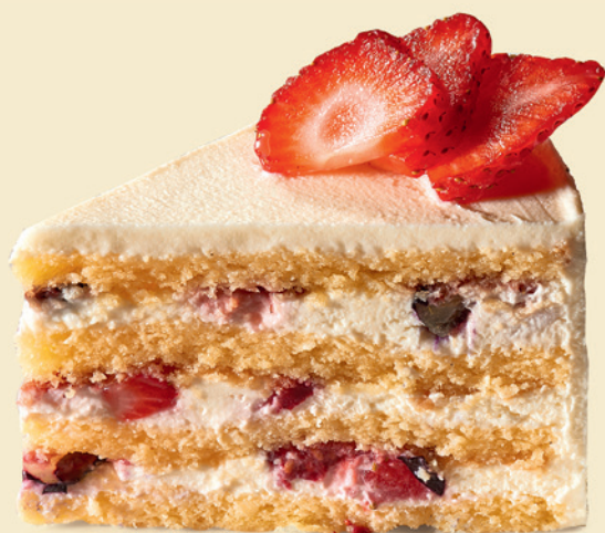
Торт ягодный | 390 ₽ |