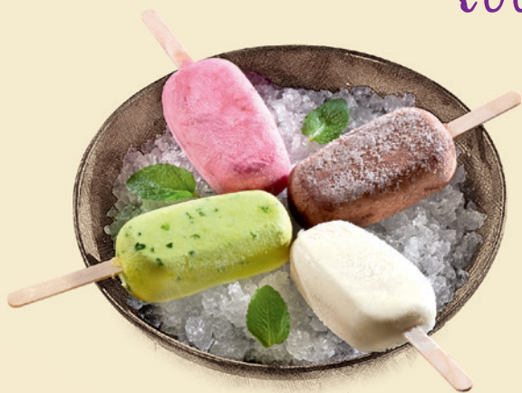
Ассорти эскимо 760 ₺