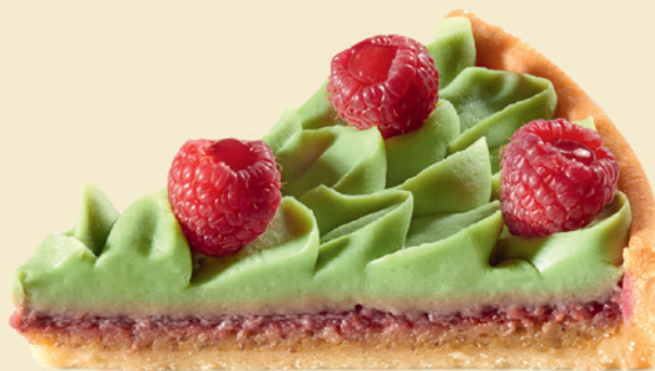
Тарт фисташка-малина | 390 ₺ |