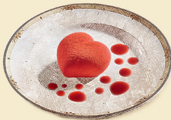
Пирожное с манго и клубникой 350 ₺