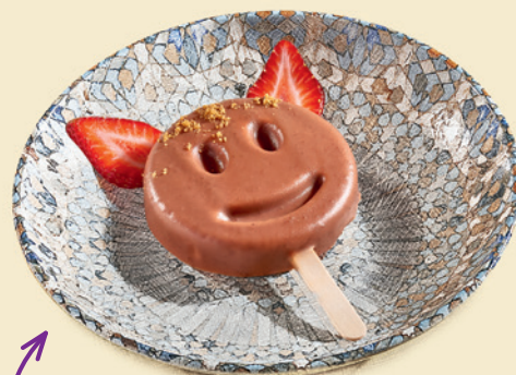
Смайлик творожный с молочным шоколадом 320 ₺