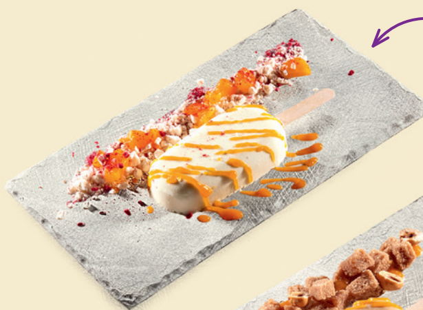
Кокосовое семифредо 350 ₺