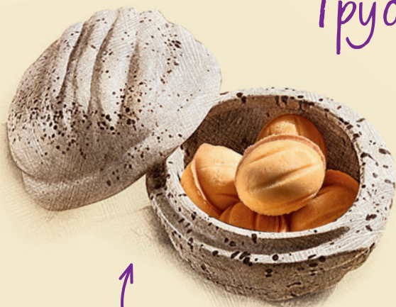
Орешки со сгущёнкой 290 ₺ (5 шт.)