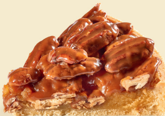
Тарт пекан | 390 ₺ |