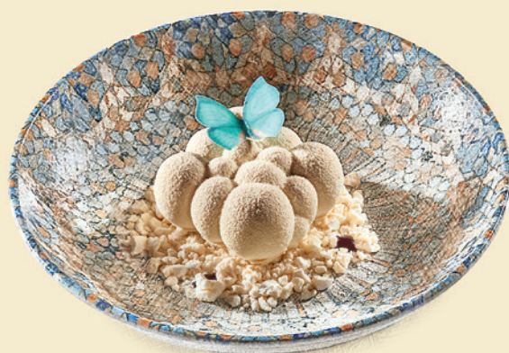
Пирожное «Облако» 450 ₺