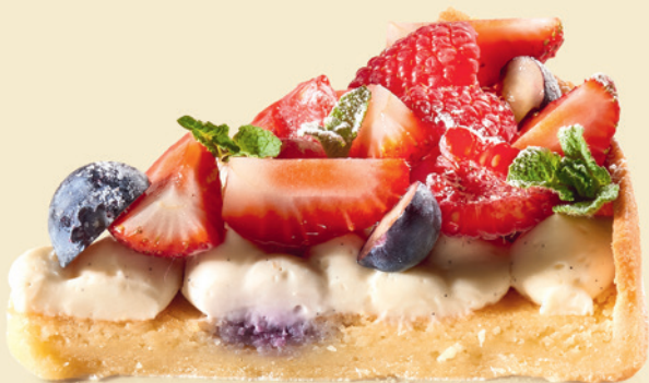
Тарт с ягодами | 390 ₺ |