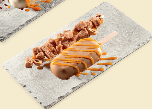
Фундучное семифредо 350 ₺