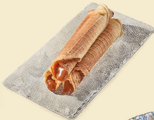
Вафельная трубочка с варёной сгущёнкой 150 ₺ (1 шт.)