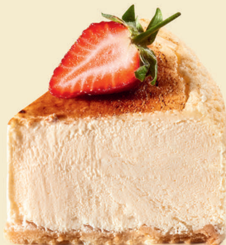
Торт «Чизкейк» | 350 ₽ |