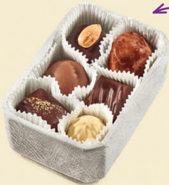
Шкатулка с конфетами ручной работы (6 шт.): пралине, фисташка, марципан, кокос, трюфель с коньяком, трюфель 350 ₺