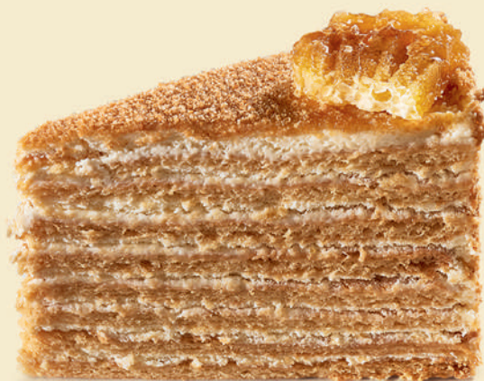
Торт «Медовик» | 350 ₽ |