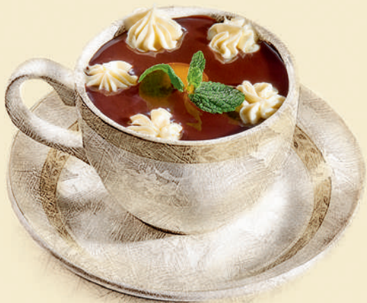
Птичье молоко 370 ₺