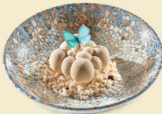
Пирожное «Облако» 450 ₺