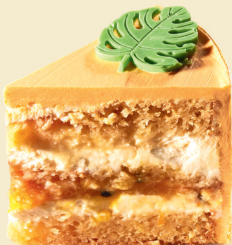
Торт тропический | 370 ₽ |