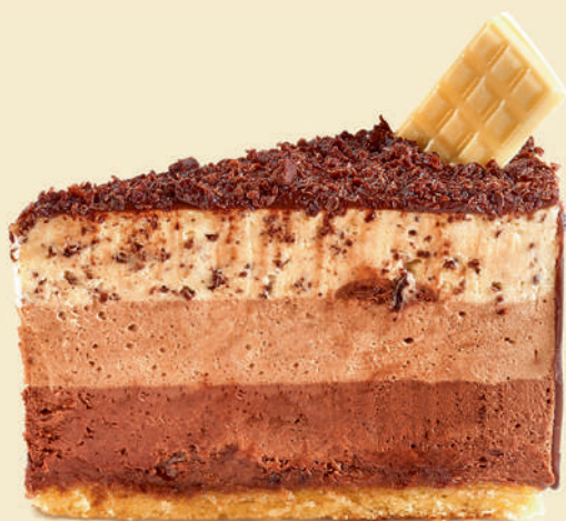
Торт «Три шоколада» | 390 ₽ |