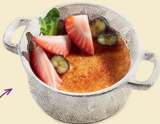
Крем-брюле с ягодами 390 ₺