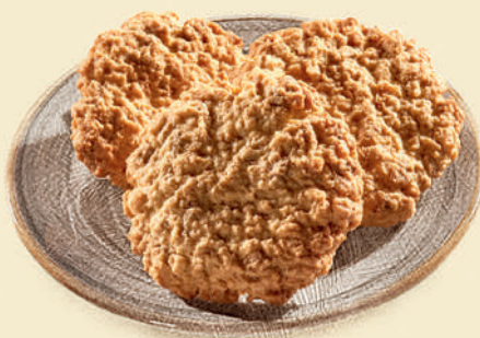
Овсяное печенье с орехами и финиками 250 ₺ (100 г)