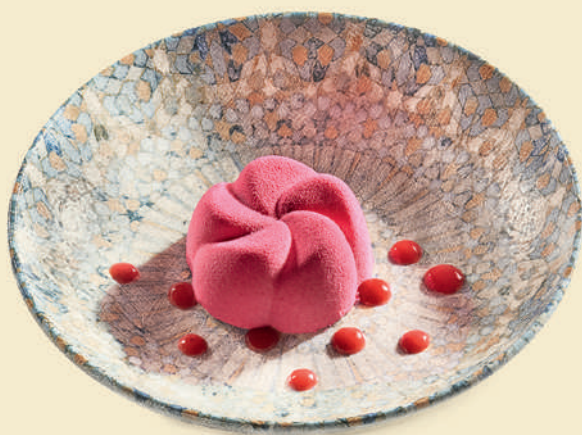
Пирожное «Красный бархат» 350 ₺