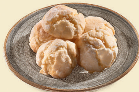
Лимонное печенье 250 ₺ (100 г)