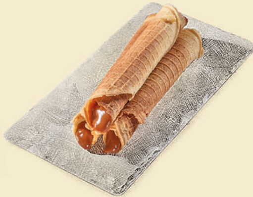
Вафельная трубочка с варёной сгущёнкой 150 ₺ (1 шт.)