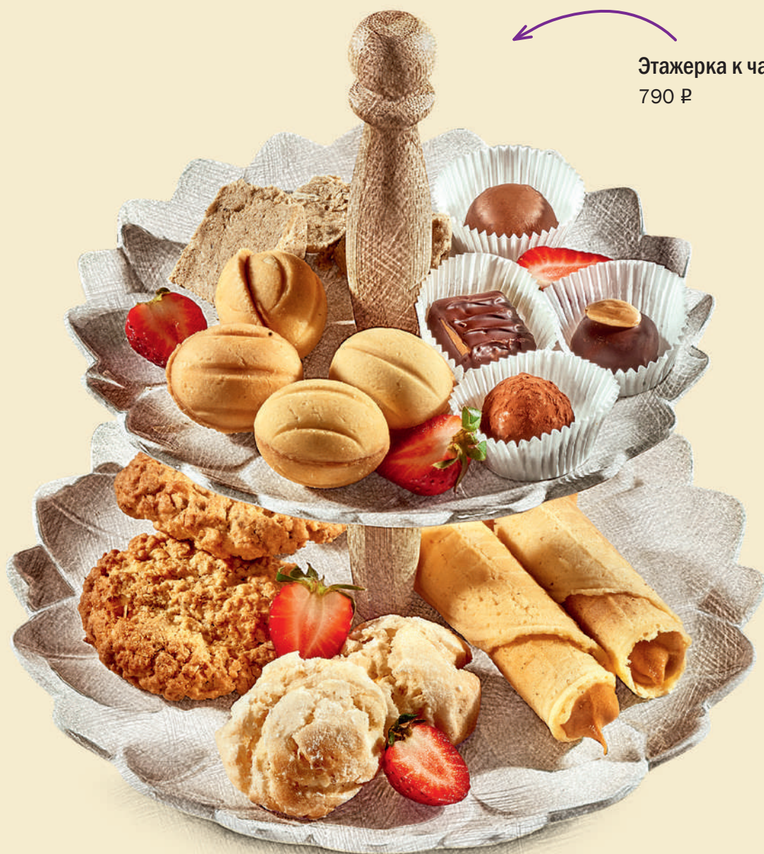
Этажерка к чаю 790 ₺