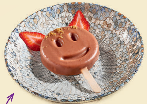
Смайлик творожный с молочным шоколадом 320 ₺