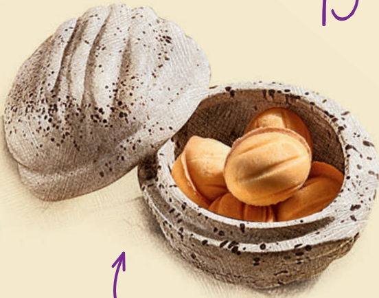
Орешки со сгущёнкой 290 ₺ (5 шт.)