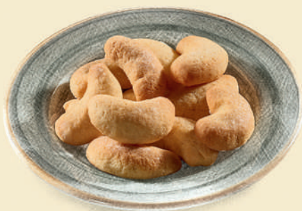
Курабье 250 ₺ (100 г)