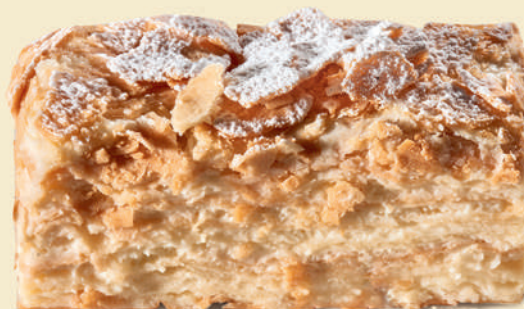
Торт «Наполеон» | 350 ₽ |